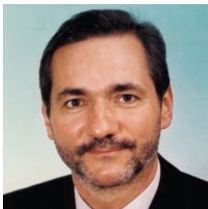
Schirmherr der Konferenz 2007 Matthias Platzeck Ministerpräsident Brandenburg

„Um Personal zu akquirieren, das sich den geänderten wirtschaftlichen und gesellschaftlichen Rahmenbedingungen zu stellen vermag, werden [...] das Land und die Kommunen in einem harten Wettbewerb zur Wirtschaft stehen. Umso wichtiger ist es, [...] geeignete Maßnahmen zu ergreifen, um die öffentliche Verwaltung auf die Anforderungen des demografischen Wandels vorzubereiten.“